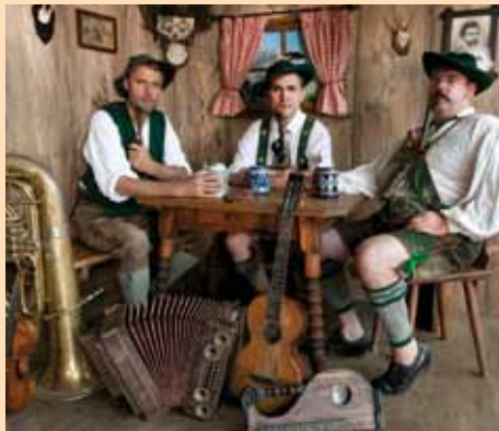
Knedl & Kraut

Sichern Sie sich jetzt Ihre Karten unter Tel. 08821 – 983 0 oder info@haus-hammersbach.de .